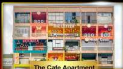
The Cafe Apartment