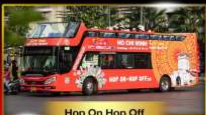
Hop On Hop Off